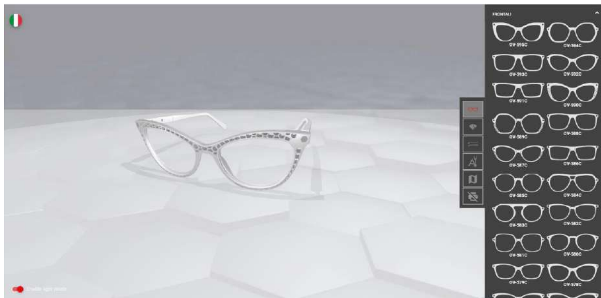
1) FORME E DIMENSIONI

finitura tra lucida e opaca.I colori saranno in continuo aggiornamentosecondo le tendenze del mercato.