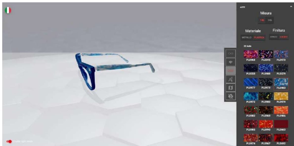
3) TIPO E COLORE DEL TEMPIO

4) L'ultimo passaggio sarà possibile inserire il nome o virgolette fino a 10 cifre in 6 diversi colori, a rifare il nuovo telaio, 100% individuale e personale.