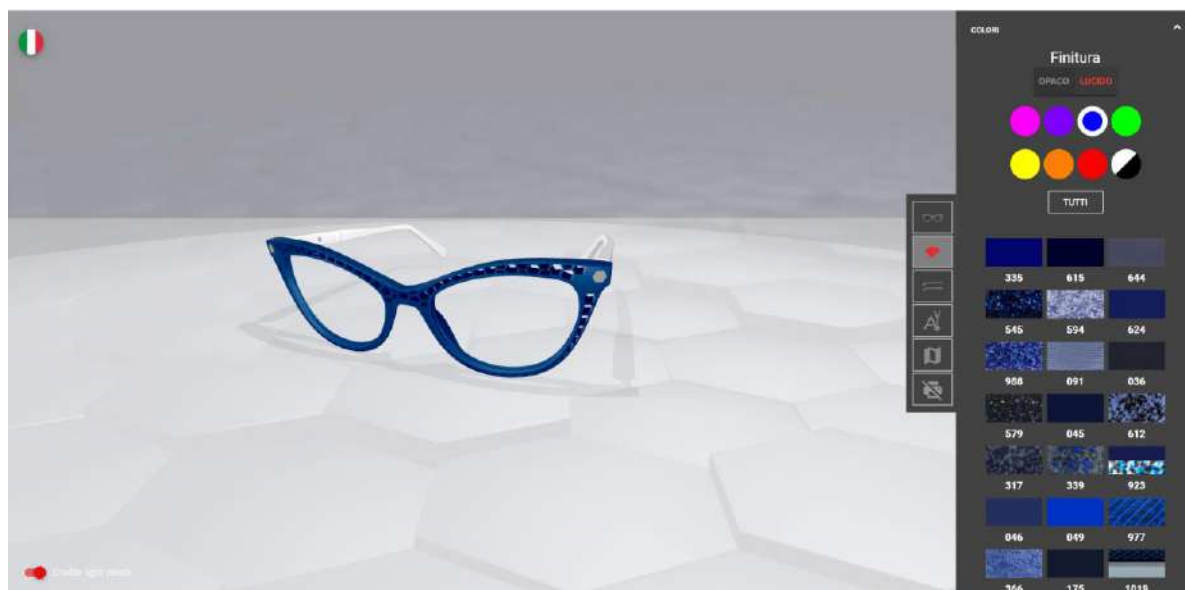
2) COLORE FRONTALE E FINITURA